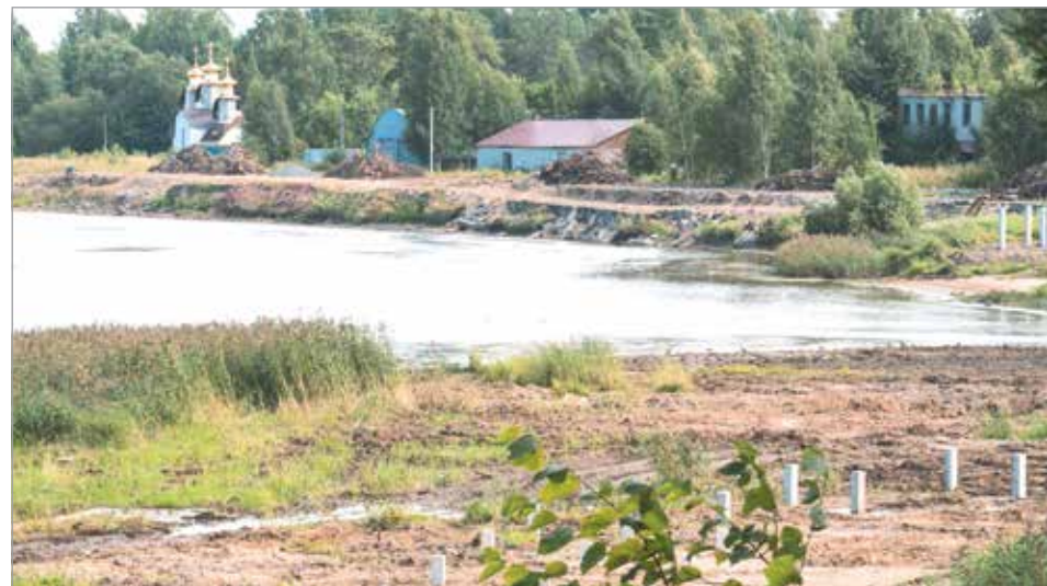
Сваи забиты на всём протяжении набережной