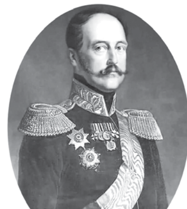
Николай I, император Всероссийский, царь Польский и великий князь Финляндский

также в силу общей отсталости, всё более и более слабела.