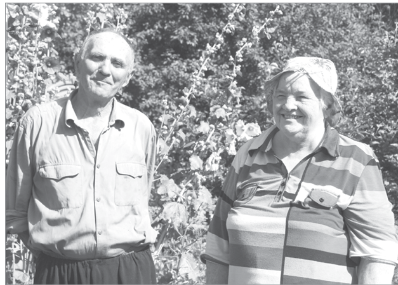
Супруги Смутько всё делают вместе!