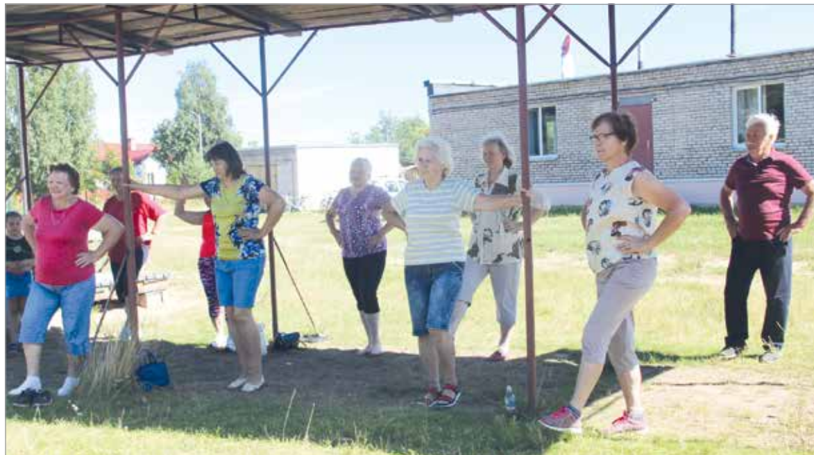
Занятия физкультурой для них стали нормой жизни