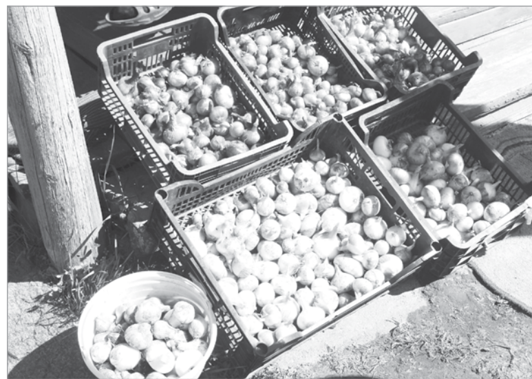
Вот это урожай!