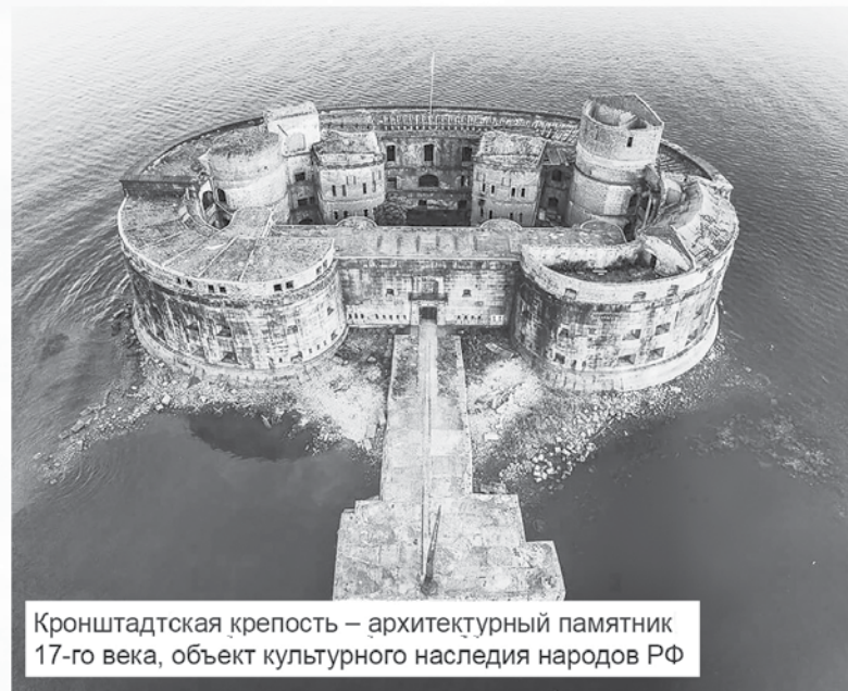
Кронштадтская крепость – архитектурный памятник 17-го века, объект культурного наследия народов РФ

Форт «Павел I» – самый мощный форт Кронштадта. В наше время осталась одинокая башня и часть цокольного этажа с обломками стены