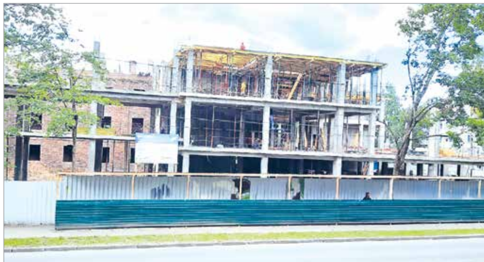
На пр. Ленина возводится центр притяжения детей и молодежи (ДЦЭР)