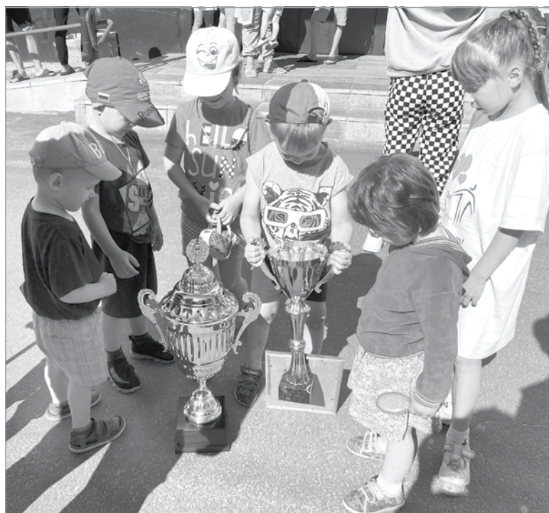
Совсем не праздное любопытство

Все районы 47-го региона пытаются наладить эффективную работу с ДНД. У одних это получается лучше, у других – хуже. По данным комитета правопорядка и безопасности области, наиболее активно в совместной работе с народными дружинниками себя проявляют Приозерский, Гатчинский и Бокситогорский районы. В настоящее время в реестре народных дружин и общественных объединений правоохранительной направленности Ленинградской области зарегистрирована 101 народная дружина. Из них 10 – на базе казачьих объединений, крупнейшая ДНД – на базе объединения «Киришинефтеоргсинтез». Общая численность добровольцев – около 1400 человек. Дружинники оказывают ощутимую помощь правоохранительным органам.