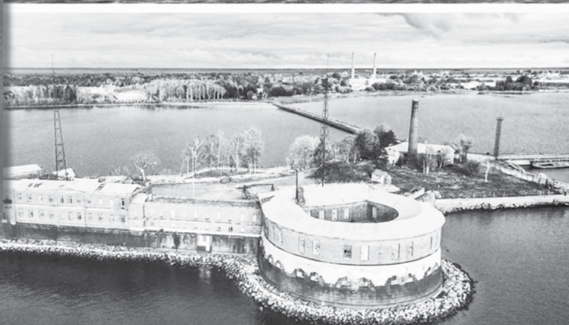
Форт «Пётр I», он же форт «Цитадель». Памятник истории и архитектуры 18-го века. Объект культурного наследия народов РФ

глубину 2,7 метра устанавливались 43 дубовых ряжевых ящика, заполненных камнями.