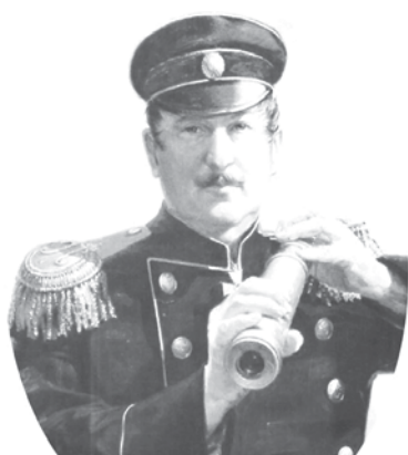
Павел Степанович Нахимов, адмирал, герой Севастопольской обороны

Таким образом, союзная эскадра имела 14 винтовых линейных кораблей, 14 парусных линейных кораблей, 31 паро-