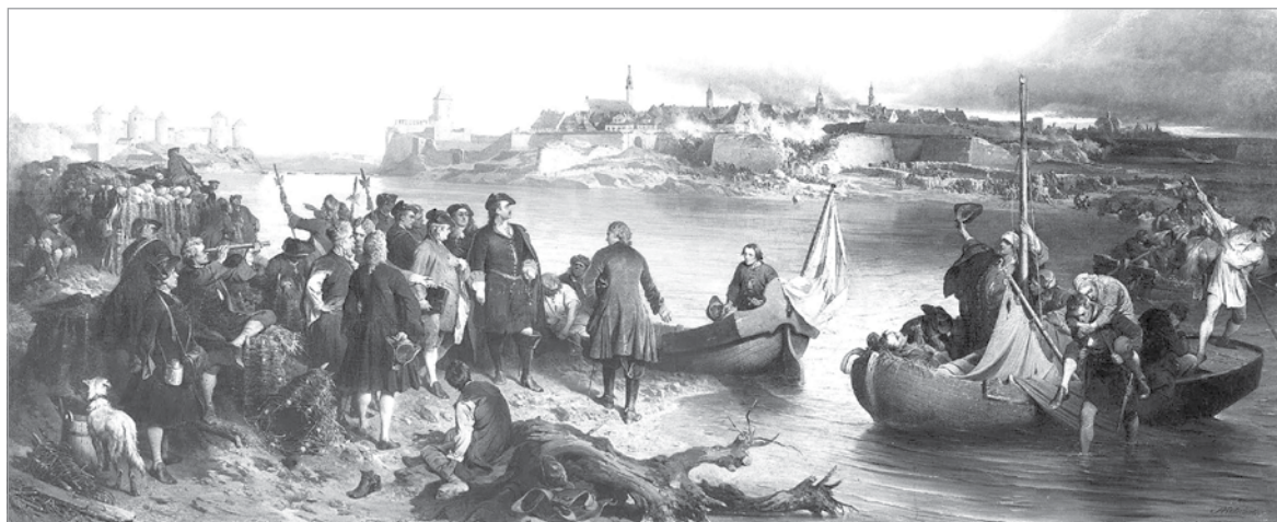
Осада Нарвы войсками Петра Первого

Стычки на приграничной территории продолжались весь семнадцатый век. Шведы совершали нападения и в южной части Приладожья, пользуясь преимуществами своих военных