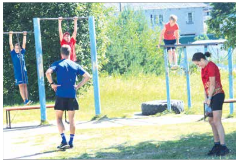
Без постоянных тренировок результатов не будет, настаивают ребят тренеры