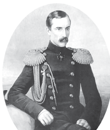
Владимир Алексеевич Корнилов, вице-адмирал, герой Крымской войны