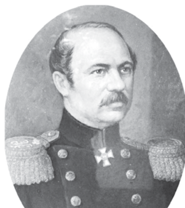
Владимир Иванович Истомин, контр-адмирал, герой Севастопольской обороны

Именно в Крымской войне были на практике реализованы те технические и тактические новинки, которые уже несколько десятилетий будоражили умы военно-морских деятелей ведущих