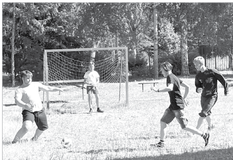
Матч товарищеский, но команды – соперники!

Физкультура и здоровый образ жизни – основополагающие факторы счастливой жизни.