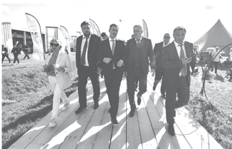
Мероприятие посетили министр сельского хозяйства РФ Дмитрий Патрушев (в центре) и губернатор Ленобласти Александр Дрозденко

Машины двигались по пашне неспешно, уверенно, работали с ювелирной точностью. Залог успеха здесь не сила и скорость, а качество и расчёт. Одним словом – искусство!