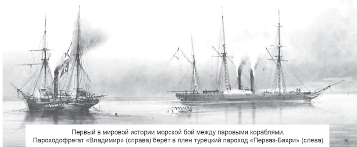
Первый в мировой истории морской бой между паровыми кораблями. Пароходофрегат «Владимир» (справа) берёт в плен турецкий пароход «Перваз-Бахри» (слева)