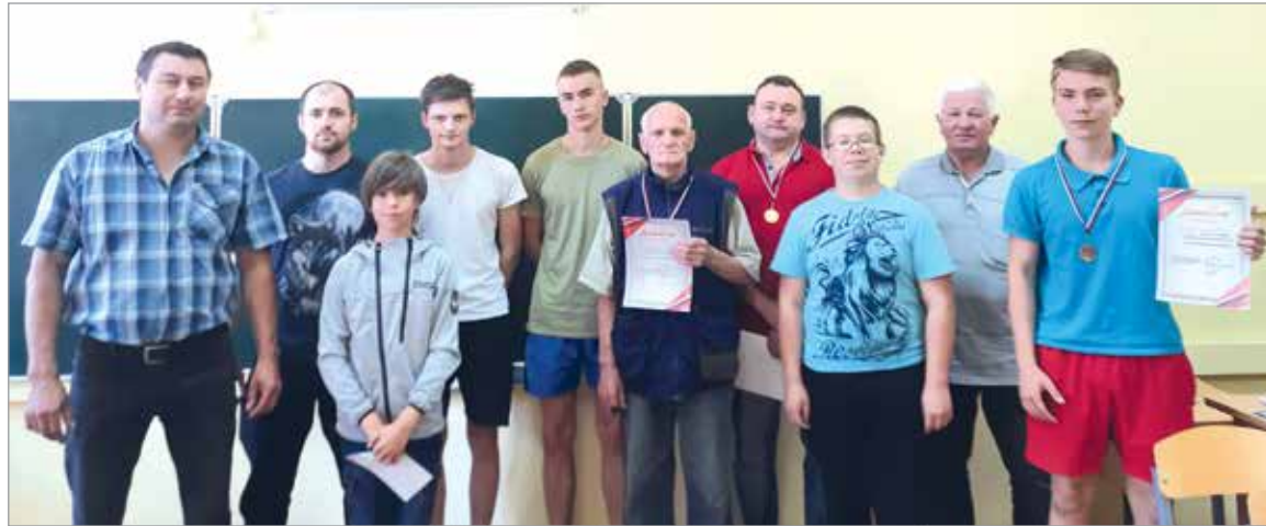
Дружная команда лодейнополюских шахматистов